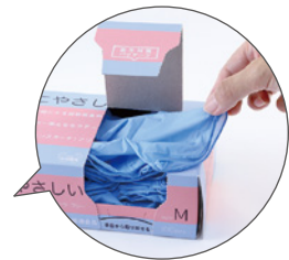
手首側から取り出せる 衛生対策パッケージ採用

商品名：エクストラフリーブルー ニトリル手袋 入数：100枚×24箱 サイズ：SS・S・M・L 主材料：合成ゴム（ニトリル） 表面加工：全面シボ加工 パウダーの有無：パウダーフリー 食品衛生法：規格適合品