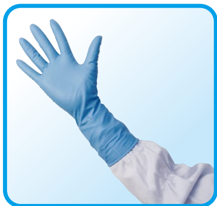
左右兼用 / パウダーフリー